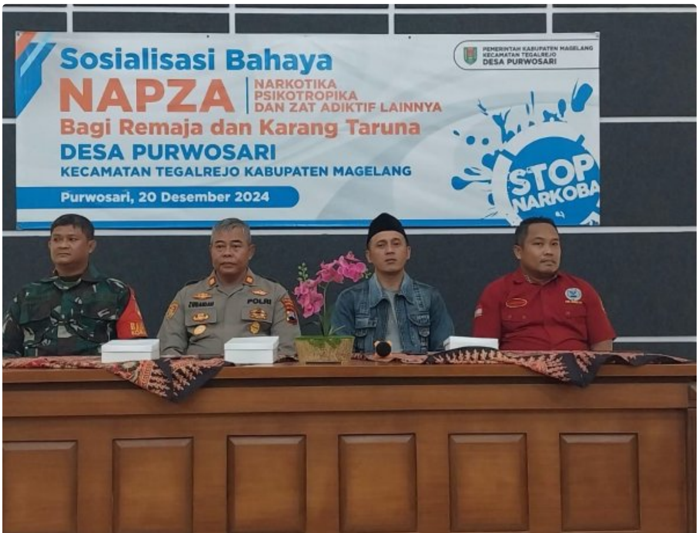
(Foto Dokumen) : Kegiatan sosialisasi bahaya narkoba dan kenakalan remaja

MAGELANG - Anggota Koramil 09/Tegalrejo bersama Polsek setempat dan anggota BNN memberikan sosialisasi tentang bahaya narkoba dan kenakalan